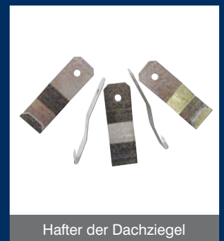
Hafter der Dachziegel